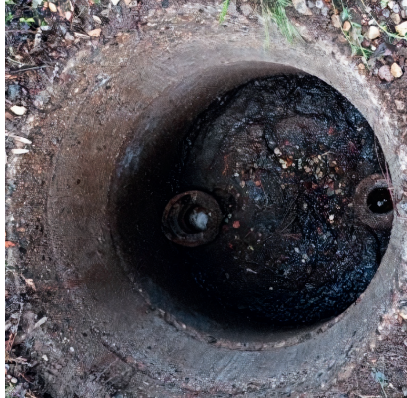
Et eksempel på sten i tanken, der gør, at den kun bliver delvist tømt.